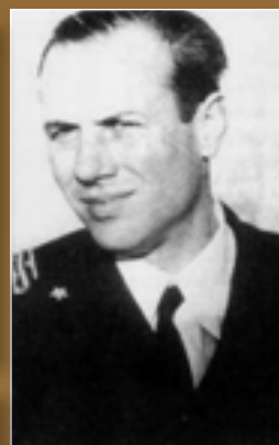
Junio Valerio Borghese, che legò il suo nome allo Scirè . A sinistra, un maiale in azione. Sotto, un Aro usato dagli uomini rana.

collega di lavoro, mi regalò una copia, ricevuta in eredità dal nonno, della prima edizione (1950) dell'autobiografia delle vicende belliche fino al settembre 1943 di Borghese: "Decima Flottiglia Mas", nella quale con prosa scarna, ma molto efficace, e soprattutto con molta semplicità, il principe narra le vicende della Decima e dello Scirè facendo sembrare ordinarie cose invece eccezionali. Allo Scirè fu assegnata l'Operazione BG 2, il secondo attacco a Gibilterra. Il 21 ottobre 1940 il sommergibile,