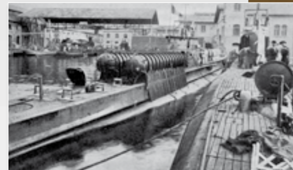
Le catene usate dagli americani per il fallito tentativo di recupero. A lato, lo Scirè con i contenitori degli SLC.

Fatto salvo che l'allora comandante della Mediterranean Fleet era l'ammiraglio Henry H. Harwood e non Andrew B.